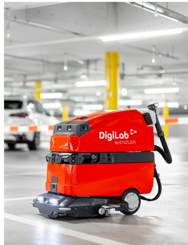
Unser DigiLab-Reinigungsroboter Marvin im Einsatz

Das DigiLab by Enzler ist mehr als nur ein Innovationsprojekt – es ist ein Versprechen an unsere Kunden und Mitarbeitenden, dass wir die Zukunft der Gebäudereinigung aktiv gestalten und vorantreiben .