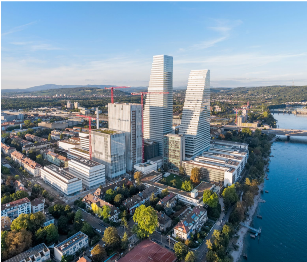
Hauptsitz Roche Basel, die vier pRED Gebäude im Vordergrund

Die Bauendreinigung eines der weltweit führenden Forschungszentren, des Roche pRED Center in Basel, war eine Mammutaufgabe und stellte unser Reinigungsteam vor zahlreiche Herausforderungen. In einem exklusiven Gespräch mit dem verantwortlichen Equipenchef Liridon Bajrami erhielten wir tiefgehende Einblicke in dieses beeindruckende Projekt.