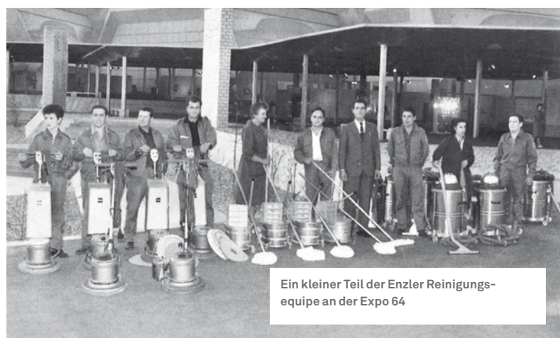
Ein kleiner Teil der Enzler Reinigungs-equipe an der Expo 64

Mit 75 Leuten sorgte Enzler für die Sauberkeit an der Expo 64 in Lausanne, vom Beginn der Baureinigung bis zum Ausstellungsende acht Monate später. Für die Reinigung der 100 000 m 2 Böden und 20 000 m 2 Glasflächen arbeitete unser Personal mit den damals modernsten Wisch- und Saugmaschinen, für deren Unterhalt ein hauptamtlicher Mechaniker verantwortlich war.