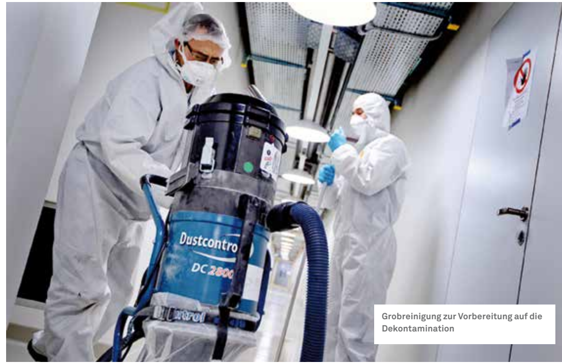
Grobreinigung zur Vorbereitung auf die Dekontamination

war für deren sicheren und effizienten Einsatz verantwortlich. PSV Montage Service ist spezialisiert auf die Reinigung von Lüftungsanlagen, die beim neuen Firmengebäude des Kunden ebenfalls dekontaminiert wurden. Nach dreimonatiger intensiver Arbeit von ungefähr 25 Mitarbeitenden, 750 Labormessungen des Kompetenzzentrums Hygiene der Enzler Hygiene AG und ca. 800 Litern verdampftem Wasserstoffperoxid konnte der Auftrag vom