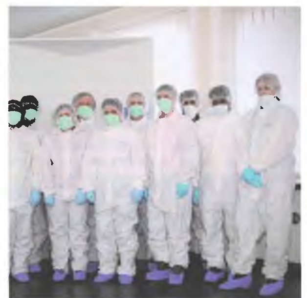
Höchste Hygienestandards müssen eingehalten werden

genau damit erfüllen wir unser Leistungsversprechen.